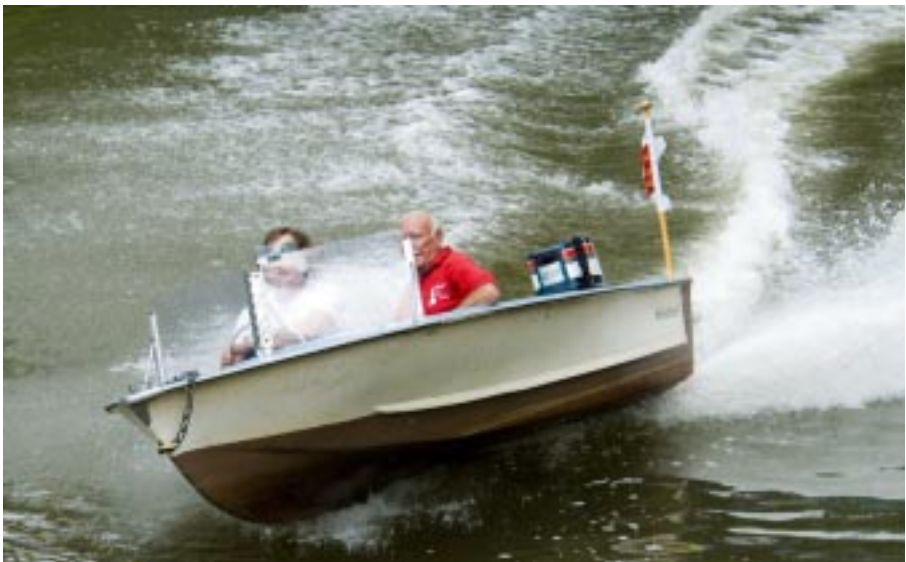
Photo-Nachlese vom Drachenbootcup 2008

Dieses Photo findet sich im Örtlichen Telefonbuch 2008/2009. Es scheint von einer unserer Waiblinger Regatten zu stammen.